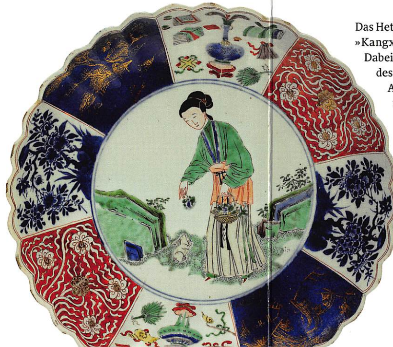
Dame mit Hase Porzellan, Ära Kangxi (1662–1722) Norddeutsche Privatsammlung

Große Mengen an Porzellan wurden jährlich in streng arbeitsteiligen Prozessen in Handarbeit gefertigt und mit Schiffen und Karawanen exportiert. Die wegen ihrer Schönheit und Qualität geschätzten Kangxi-Porzellane, die von den Ostindienkompanien der Engländer, Franzosen und Niederländer nach Europa überführt wurden, schmückten die Schatzkammern der europäischen Fürsten. Der Prestigeerfolg war enorm, so dass sich auch in den wohlhabenden europäischen Gesellschaften die Teemode verbreitete und die Begeisterung für China wie ein Lauffeuer entzündete. Nicht zuletzt auch aus diesem Grund, wurde die Nacherfindung des Porzellans in Europa vorangetrieben.