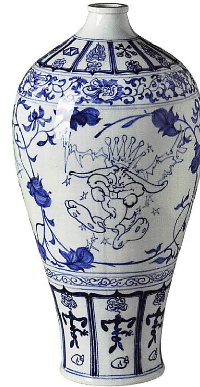
Lei Xue Wirtschaft, Porzellan (2009) Galerie Martina Detterer, Frankfurt

Das Hetjens-Museum beleuchtet das Thema »Kangxi-Porzellan« aus Perspektive der Auftraggeber. Dabei werden die geschmacklichen Vorlieben des chinesischen Kaiserhofes sowie die Auftragswünsche der europäischen Fürsten und orientalischen Händler eingehend vorgestellt, um eine faszinierende Übersicht der vielgestaltigen Porzellankunst der Kangxi-Ära zu zeigen. Auf diese Weise wird die Blüte des chinesischen Porzellans in vielerlei Facetten in Düsseldorf zu bestaunen sein.