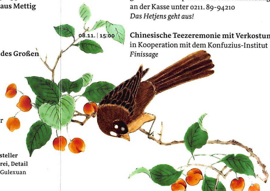
»Familie verte«-Geburtstagsteller mit Vogel- und Blumenmalerei, Detail Åra Kangxi (1713), Sammlung Gulexuan